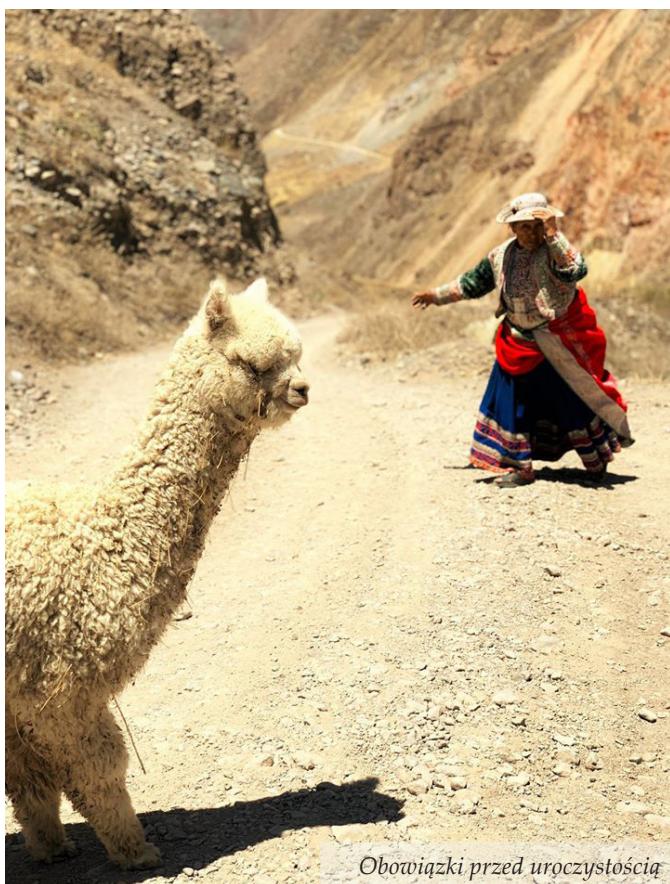
Obowiazki przed uroczystoscia