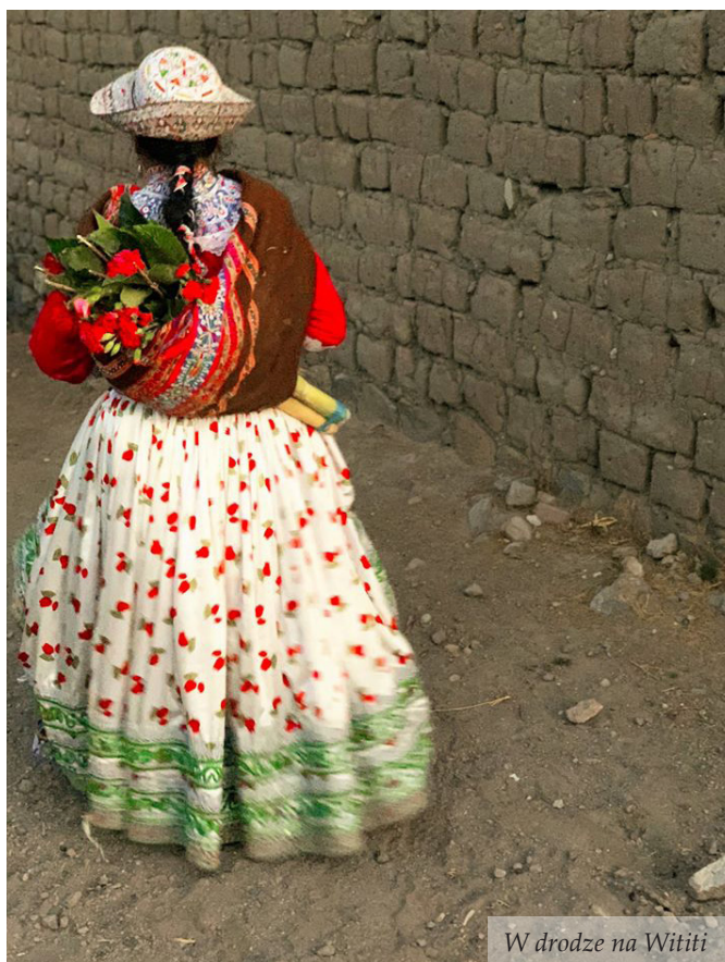
W drodze na Wititi