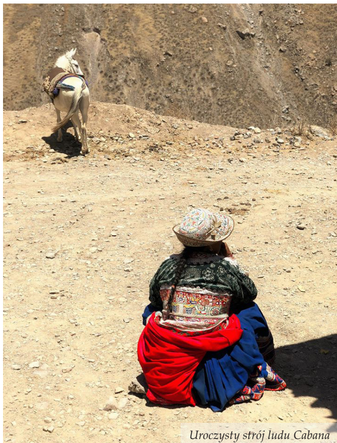
Uroczysty strój ludu Cabana