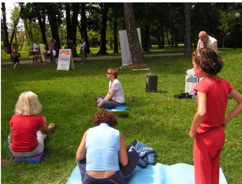
Zdjęcie 14. Grupa konsumentów zdrowej żywności . Ta sama grupa praktykująca jogę słucha po ćwiczeniach jogi wykładu nt. zdrowej żywności zatytułowanego „Cukier zabójcą”. „Jednostki społeczne” podlegają transformacji, porównywanie fotografii pomaga te transformacje uchwycić (zdjęcie autora, projekt badawczy na temat jogi, Łódź, 2008).

Jednostki mogą być również połączone z pewnym otoczeniem terytorialnym, jak również z danym obszarem środowiskowym, gdzie mają miejsce pewne działania